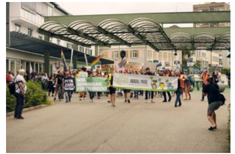
Animal Pride Day